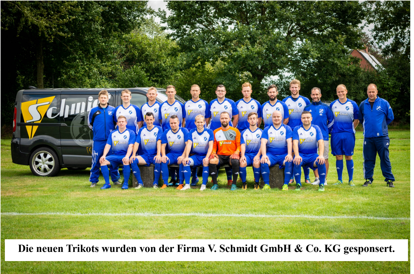
Die neuen Trikots wurden von der Firma V. Schmidt GmbH & Co. KG gesponsert.